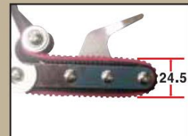
◎SMALL ROLLER TYPE

ROLLER의 표면은 체인모양으로 작업물이 얇거나 두꺼운 매듭도 잘 당기는 기능을 가지고 있습니다. ROLLER surfaces the work are thin with the chain shape, or it has the function where also the knot which is thick is stimulated well