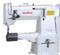
Sylinder Bed, Flat Bed Type